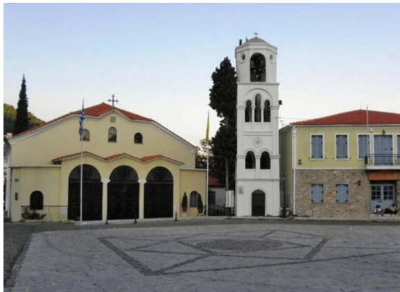
Εικόνα 4: Η πλατεία Μητροπόλεως, τόπος έναρξης της ξενάγησης.