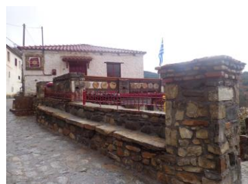
Εικόνα 2: Το Διδασκαλείο της Ακαδημίας Ποίησης και Παραμυθιού.