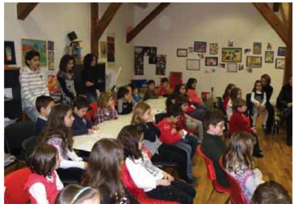
Εικόνα 5: Η αίθουσα του ΙΘΤΠ όπου υλοποιείται το πρόγραμμα.

Ο χώρος αυτός είναι εξοπλισμένος με καρέκλες και τραπέζια, ώστε να μπορεί να φιλοξενήσει άνετα μια σχολική τάξη. Παράλληλα, υπάρχει ελεύθερος χώρος καθώς και τα απαραίτητα υλικά για τις διάφορες δραστηριότητες. Υπάρχουν, ακόμα, χώροι υγιεινής για παιδιά και ενήλικες.