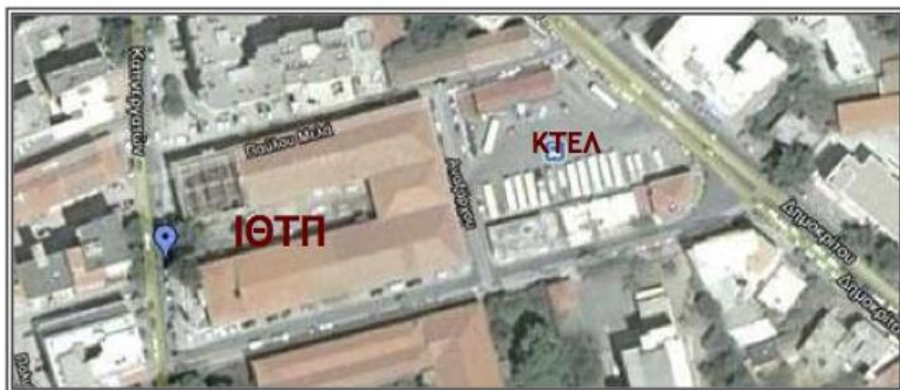
Εικόνα 2: Η Καπναποθήκη «Π» επί της οδού Καπνεργατών 9, πίσω από τα ΚΤΕΛ Ξάνθης.