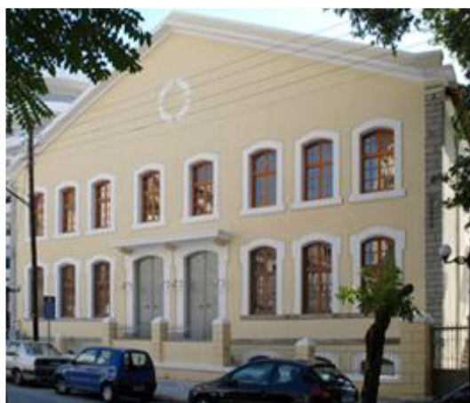
Εικόνα 1: Η Καπναποθήκη «Π» του ΙΘΤΠ επί της οδού Καπνεργατών 9 στην Ξάνθη.

Στο διάστημα λειτουργίας του, εξελίχθηκε σε πρότυπο πολιτισμικής οντότητας με την αξιοποίηση, υποδειγματική αναστήλωση και διαχείριση διατηρητέων μνημείων της βιομηχανικής κληρονομιάς , με ιστορικό και αισθητικό ενδιαφέρον. Οι ποικίλες δράσεις του Ιδρύματος στεγάζονται σε συγκροτήματα της περιοχής των καπναποθηκών Ξάνθης με συνολική έκταση στην παρούσα φάση πλέον των 2.000 τ.μ.