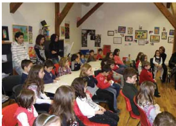
Εικόνα 5: Η αίθουσα του ΙΘΤΠ όπου υλοποιείται το πρόγραμμα.

Η Καπναποθήκη, ένα μεγάλο και επιβλητικό κτίριο, αποκατεστημένο κατά ένα μέρος από το