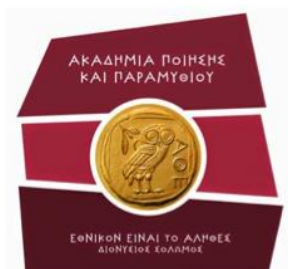
Εικόνα 1: Το λογότυπο της Ακαδημίας Ποίησης και Παραμυθιού.