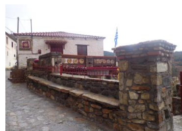
Εικόνα 2: Το Διδασκαλείο της Ακαδημίας Ποίησης και Παραμυθιού.