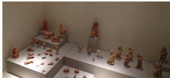
Εικόνες 3 και 4: Οικία στον αρχαιολογικό χώρο των Αβδήρων και η προθήκη στο μουσείο σχετικά με τα παιχνίδια.